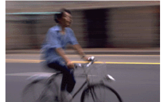
Bijschrift bij afbeelding.

Plaats de afbeelding die u hebt gekozen vlakbij het artikel en het bijschrift van de afbeelding vlakbij de afbeelding.