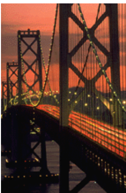
Bijscript bij afbeelding.

Dit artikel kan 175 tot 225 woorden bevatten.